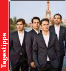
Tagestipps Gegründet im Jahr 2003 in Paris, zählt das Quatuor Modigliani heute zu den führenden Streichquartetten