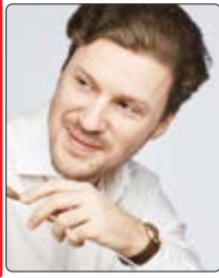
Stanislaw Kochanowski (Foto) dirigierte im NDR Konzerthaus Hannover Werke von Rimski-Korsakow und Medtner