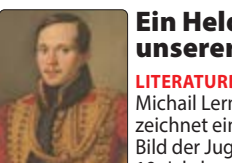
Ein Held unserer Zeit LITERATURBEARBEITUNG Michael Lermontov (Abb.) zeichnet ein illusionsloses Bild der Jugend im frühen 19. Jahrhundert. Mit der Figur des Offiziers Petschorin schuf er einen der ersten Dandys der Weltliteratur. 115 Min.