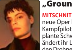
„Grounded“ MITSCHNITT Jeanine Tesoris neue Oper kreist um die Kampfpilotin Jess. Eine ungeplante Schwangerschaft verändert ihr Leben. Sie wird in den Drohnen dienst in die Wüste Nevadas versetzt. Die Partie der Jess übernahm Emily D'Angelo (Foto; vom 19.10.). 180 Min.

Ascheregen und Lava-Flüsse FEATURE Der Südwesten Islands wird seit 2021 von zahlreichen Vulkanausbrüchen heimgesucht. Die Vulkane sind von einer Touristenattraktion zu einer Bedrohung geworden, und doch gehen die Isländer fast routiniert damit um. 55 Min.