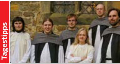
Das Vokalensemble Heinavanker präsentierte gregorianische Gesänge und estnische Volkslieder