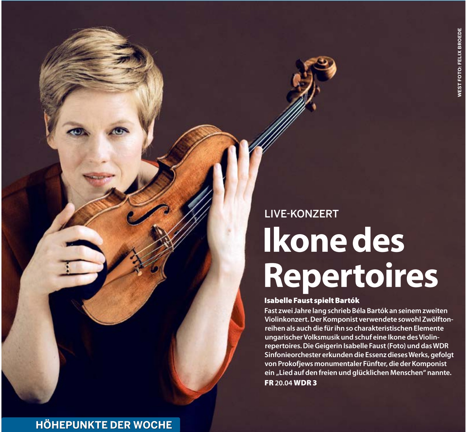
WEST FOTO: FELIX BROEDE