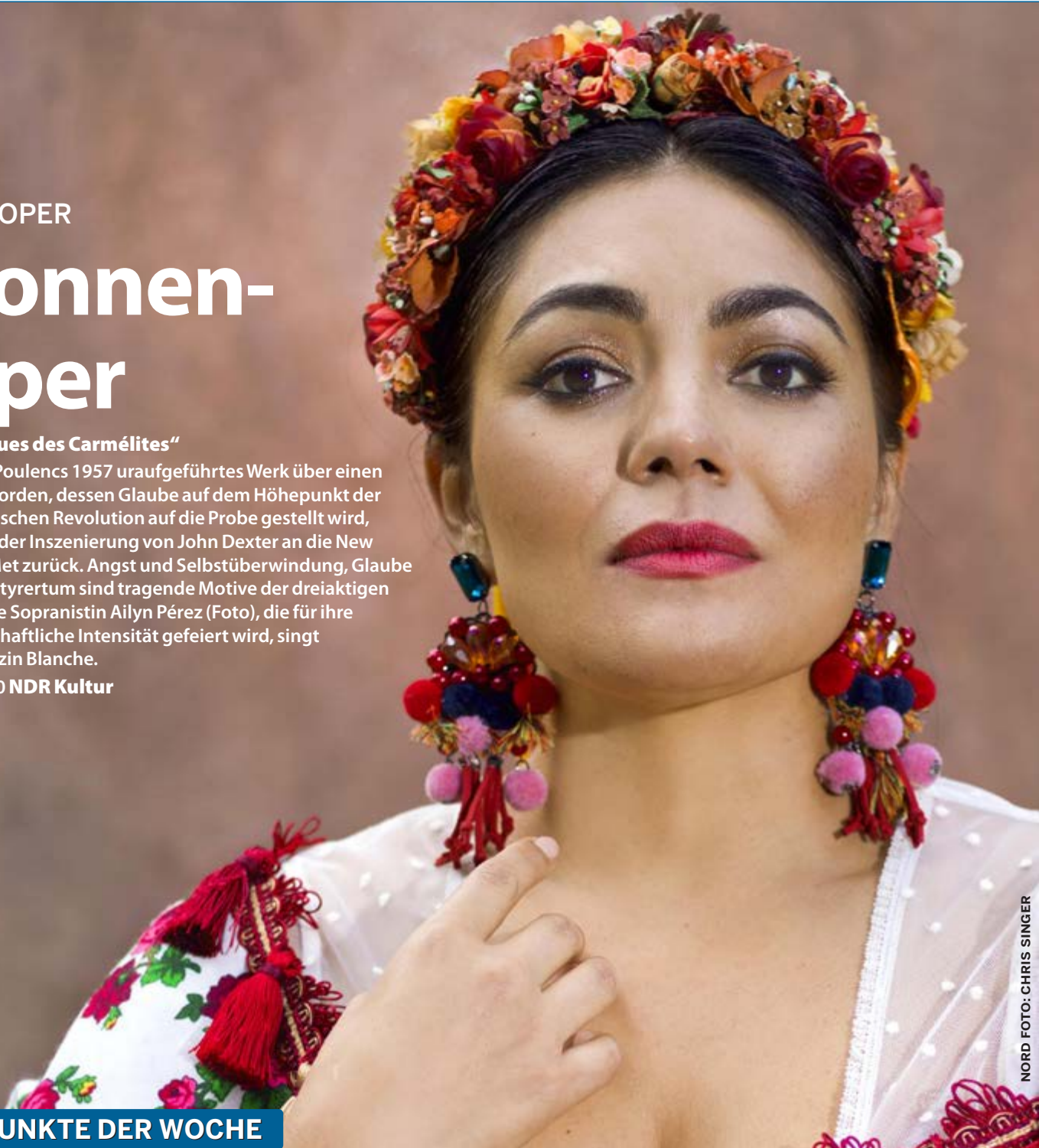
NORD FOTO: CHRIS SINGER