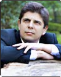
Der Pianist Javier Perianes (Foto) spielt Manuel de Fallas „Nächte in spanischen Gärten“