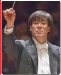
Alan Gilbert ist seit September 2019 Chefdirigent des NDR Elbphilharmonie Orchesters