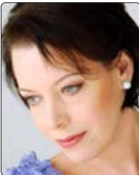
Die Sopranistin Nina Stemme sang die Wesendonck-Lieder von Richard Wagner