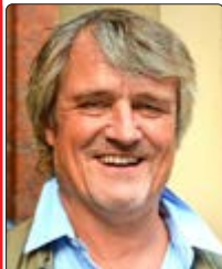
Ingo Metzmacher steht am Pult des SWR Symphonieorchesters