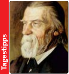
Wilhelm Raabe erzählt eine Episode aus den Befreiungskriegen in heutigen Niedersachsen und Nordhessen. Die Erzählung erschien im Jahr 1869