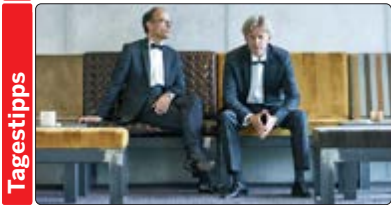
Das Grauschmacher Piano Duo hat das Schwetzingen Publikum schon mehrfach begeistert