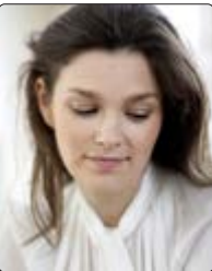
Die Geigerin Janine Jansen liebt das Violinkonzert von Jean Sibelius seit ihrer Kindheit