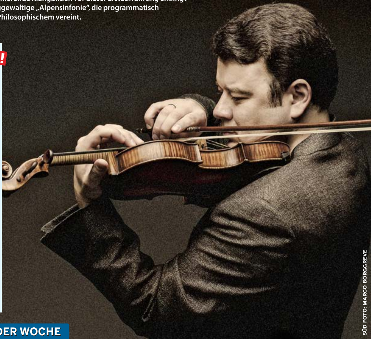
SÜD FOTO: MARCO BORGREVE

Auf Plattformen wie Spotify, Apple Podcasts u.a.