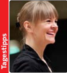
Die finnische Dirigentin Susanna Mälkki gibt ihr Debüt bei der Staatskapelle Dresden