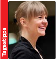
Die finnische Dirigentin Susanna Mälkki gibt ihr Debüt bei der Staatskapelle Dresden