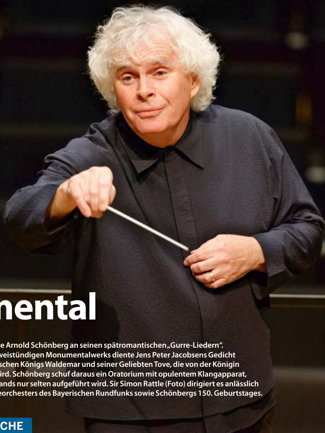
OST FOTO: ASTRID ACKERMANN

Auf Plattformen wie Spotify, Apple Podcasts u. a.