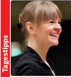
Die finnische Dirigentin Susanna Mälkki gibt ihr Debüt bei der Staatskapelle Dresden