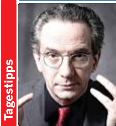
Fabio Luisi leitete die Wiener Symphoniker