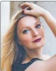
Die Sopranistin Lucy Crowe ist zu Gast beim Symphonieorchester des Bayerischen Rundfunks