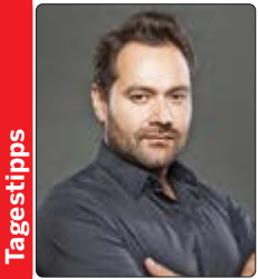
In der Titelrolle agiert der Bassist Ildar Abdrazakov