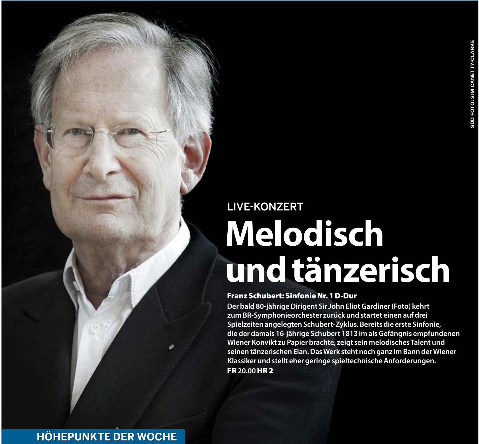
SÜD FOTO: SIM CANETTY-CLARKE