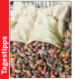
Ghana will faire Kakaopreise durchsetzen